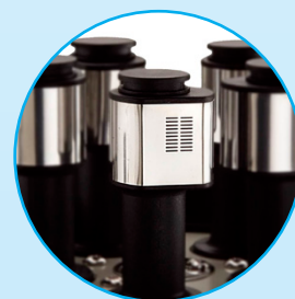
20 buchi di aspirazione