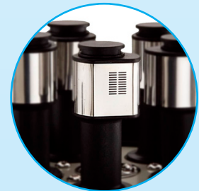
20 Loch Ansaugspindel